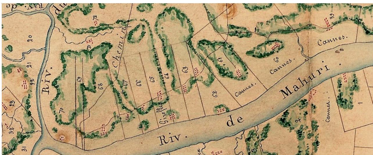
(Carte de Siredey de 1832)

N° 70 : habitation Le Pardon à la veuve Bâlé, appartient ensuite à Dupoy